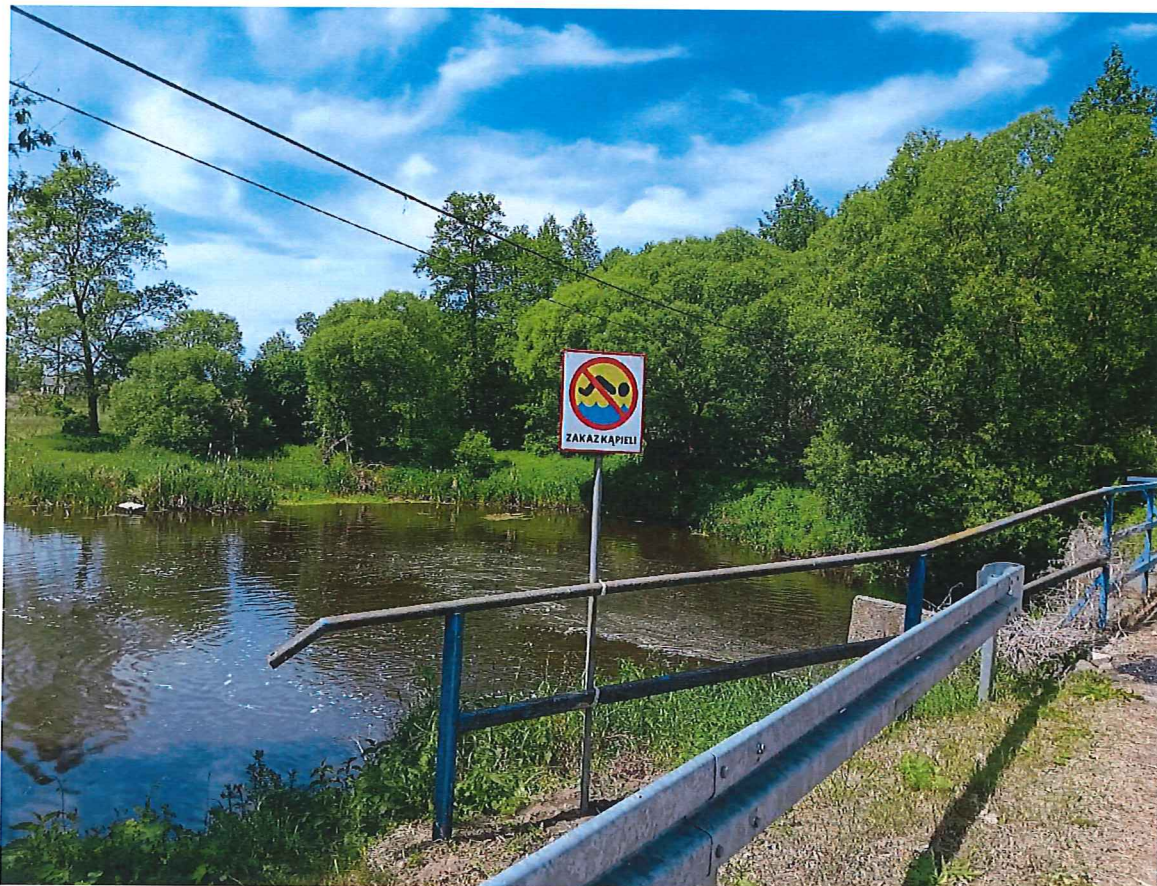
(Zdjęcie rzeki Skrwa w m. Borowo (Nadolnik) okolice mostu z umieszczonym oznakowaniem „Zakaz kąpieli”)

Wniosek: w związku z tym, że osoby potencjalnie kąpiące się w rzece nie stosują się do zakazów stanowi to podstawę do uznania tego miejsca za niebezpieczne. Zachowania tych osób mogą skutkować utratą zdrowia lub życia.