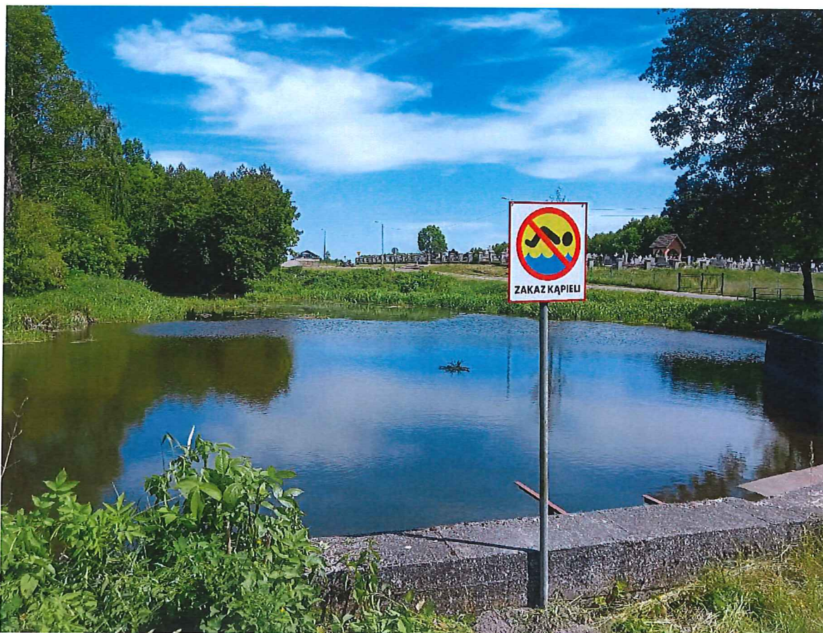
(Zdjęcie rzeki Skrwa w m. Łukomie okolice mostu z umieszczonym oznakowaniem „Zakaz kąpielii”)

Wniosek: w związku z tym, że osoby potencjalnie kąpiące się w rzece nie stosują się do zakazów stanowi to podstawę do uznania tego miejsca za niebezpieczne. Zachowania tych osób mogą skutkować utratą zdrowia lub życia.