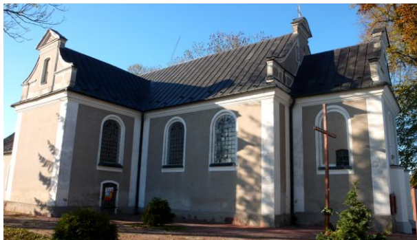
Ilustracja 1. Kościół parafialny w Rościszewie