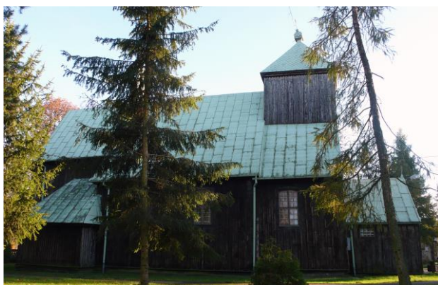
Ilustracja 4. Kościół parafialny w Łukomiu

Otoczenie kościoła parafialnego p.w. św. Józefa w promieniu 50 m w Rościszewie.