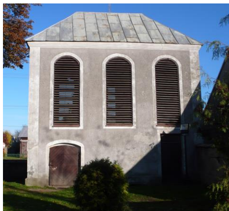
Ilustracja 2. Dzwonnica w Rościszewie