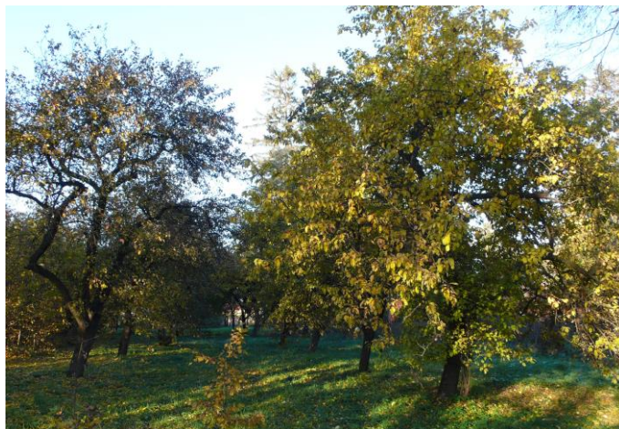
Ilustracja 9. Park w Łukomiu

Park w Łukomiu powstał na przełomie XIX i XX w., zajmuje powierzchnię około 3,7 ha. Położony jest na wysokim brzegu rzeki Skrwy, na jego terenie brak zbiorników wodnych. Stanowi on przykład ogrodu użytkowego z minimalnym układem dekoracyjno – wypoczynkowym. Ogród ma kształt wydłużonego prostokąta w układzie kwaterowym i usytuowany jest po południowej stronie drewnianego dworu, do którego od strony północnej prowadzi aleja obsadzona szpalerami kasztanowców. Po południowej stronie dworu znajduje się gazon obsadzony świerkami oraz krzewami. W zachodniej części założenia parkowego znajduje się sad, w części południowej boisko sportowe o nawierzchni trawiastej. Park posiada dość zróżnicowany drzewostan, przeważają gatunki liściaste głównie: lipa drobnolistna i grab pospolity oraz jabłonie. Wśród gatunków iglastych występuje głównie świerk zwyczajny.