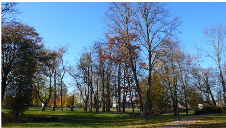
Ilustracja 8. Park w Rościszewie

Park w Rościszewie powstał w II połowie XVIII w., zajmuje powierzchnię około 2,8 ha. Położony jest w centrum wsi, otoczony zabudową mieszkaniową i drogami. Aleja dojazdowa obsadzona szpalerem kasztanowców usytuowana jest na osi głównej dworu w części wschodniej założenia parkowego. Część centralną parku tworzy układ wodny oraz aleja lipowo – grabowa, natomiast od zachodu i północy znajdują się sady owocowe otoczone szpalerami drzew liściastych. Układ komunikacyjny na terenie parku tworzą alejki spacerowe z mostkami nad kanałami wodnymi. Park posiada w większości drzewostan liściasty, występują głównie jesion pospolity, grab i lipa drobnolistna. Na terenie parku znajdują się cenne drzewa pomnikowe takie jak: klon jawor o obwodzie 286 cm, lipa drobnolistna o obwodzie 370 cm, dwa graby o obwodach 220 cm i 259 cm oraz fragmenty alei lipowej z okazami o obwodach od 202 cm do 252 cm. Znaczną część starodrzewu stanowią również kasztanowce. Wśród gatunków iglastych występuje jeden świerk srebrny i trzy żywotniki. Dużą część drzewostanu stanowią również drzewa owocowe, głównie jabłonie i grusze w dawnych odmianach o rozłożystych, malowniczych koronach.