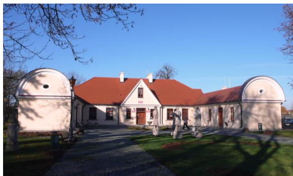
Ilustracja 6. Dwór w Rościszewie

Dwór murowany w Rościszewie powstał pod koniec XVIII w. dla ówczesnych właścicieli wsi Jeżewskich. Jego bryła zmieniała się w wyniku licznych przebudów w XIX i XX w. Wzniesiony został w stylu barokowym, Jest to obiekt parterowy, trójskrzydłowy, murowany z cegły otynkowanej na fundamentach kamiennych, częściowo podpiwniczony. Korpus główny wzniesiony został na planie wydłużonego prostokąta z wysokim dachem dwuspadowym, z dobudowanymi prostopadle skrzydłami o dachach dwuspadowych niższych od dachu budynku głównego. Obecnie obiekt stanowi własność gminy, jest po gruntownym remoncie, zachowany w bardzo dobrym stanie. W skład tego założenia dworskiego wchodzi również spichlerz usytuowany po północnej stronie dworu. Powstał pod koniec XIX w. podczas rozbudowy dworu. Wzniesiony na planie prostokąta, dwukondygnacyjny, murowany głównie z kamieni polnych i częściowo cegły na otynkowanym cokole, kryty dachem półszczytowym. Obecnie obiekt nie pełni żadnej funkcji użytkowej, stanowi własność gminy i opracowany został dla niego projekt adaptacji zabytkowego obiektu na salę chopinowską. Elementem kompleksu zabudowań zespołu dworsko – parkowych była również stajnia ; budynek ten obecnie nie istnieje.