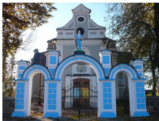
Ilustracja 3. Brama przy kościele w Rościszewie

Dzwonnica przy kościele parafialnym p. w. św. Józefa w Rościszewie (przy kościele parafialnym p.w. św. Józefa) została wzniesiona w momencie rozbudowy kościoła w 1932 roku w stylu neobarokowym. Usytuowana została w południowo – wschodnim narożniku ogrodzenia kościelnego. Dzwonnica wymurowana jest z tynkowanej cegły, na planie prostokąta, zwieńczona czterospadowym dachem.