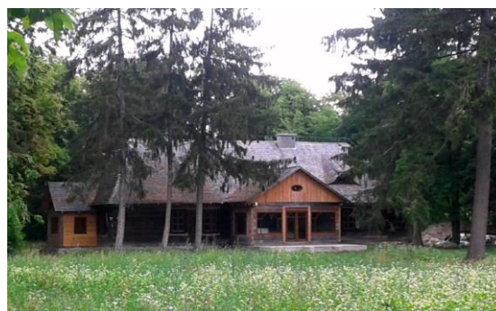
Ilustracja 7. Dwór w Łukomiu

Dwór murowany w Rościszewie powstał pod koniec XVIII w. dla ówczesnych właścicieli wsi Jeżewskich. Jego bryła zmieniała się w wyniku licznych przebudów w XIX i XX w. Wzniesiony został w stylu barokowym, Jest to obiekt parterowy, trójskrzydłowy, murowany z cegły otynkowanej na fundamentach kamiennych, częściowo podpiwniczony. Korpus główny wzniesiony został na planie wydłużonego prostokąta z wysokim dachem dwuspadowym, z dobudowanymi prostopadle skrzydłami o dachach dwuspadowych niższych od dachu budynku głównego. Obecnie obiekt stanowi własność gminy, jest po gruntownym remoncie, zachowany w bardzo dobrym stanie. W skład tego założenia dworskiego wchodzi również spichlerz usytuowany po północnej stronie dworu. Powstał pod koniec XIX w. podczas rozbudowy dworu. Wzniesiony na planie prostokąta, dwukondygnacyjny, murowany głównie z kamieni polnych i częściowo cegły na otynkowanym cokole, kryty dachem półszczytowym. Obecnie obiekt nie pełni żadnej funkcji użytkowej, stanowi własność gminy i opracowany został dla niego projekt adaptacji zabytkowego obiektu na salę chopinowską. Elementem kompleksu zabudowań zespołu dworsko – parkowych była również stajnia ; budynek ten obecnie nie istnieje.