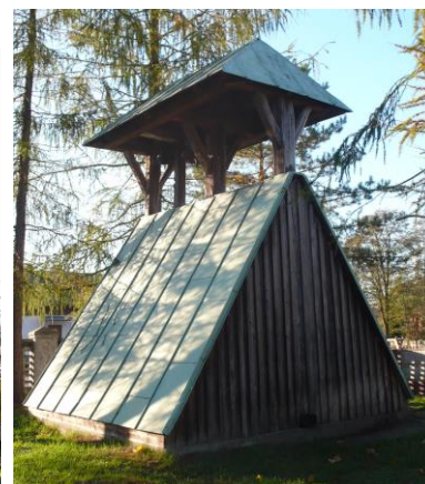
Ilustracja 5. Dzwonnica w Łukomiu