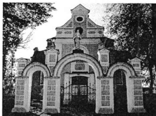
Ilustracja 3. Brama przy kościele w Rościszewie

Dzwonnica przy kościele parafialnym p. w. św. Józefa w Rościszewie (przy kościele parafialnym p.w. św. Józefa) została wzniesiona w momencie rozbudowy kościoła w 1932 roku w stylu neobarokowym. Usytuowana została w południowo – wschodnim narożniku ogrodzenia kościelnego. Dzwonnica wymurowana jest z tynkowanej cegły, na planie prostokąta, zwieńczona czterospadowym dachem. Elewacje usytuowane są na niewysokim cokole, ujęte w narożnikach płaskimi lizenami oraz zwieńczone gzymsem. Okna są wysokie o łuku zamkniętym, w bielonych opaskach. Zwieńczenie dachu stanowi żelazny, kuty krzyż.