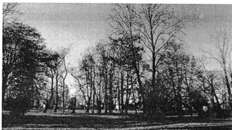
Ilustracja 8. Park w Rościszewie

dojazdowa obsadzona szpalerem kasztanowców usytuowana jest na osi głównej dworu w części wschodniej założenia parkowego. Część centralną parku tworzy układ wodny oraz aleja lipowo – grabowa, natomiast od zachodu i północy znajdują się sady owocowe otoczone szpalerami drzew liściastych. Układ komunikacyjny na terenie parku tworzą alejki spacerowe z mostkami nad kanałami wodnymi. Park posiada w większości drzewostan liściasty, występują głównie jesion pospolity, grab i lipa drobnolistna. Na terenie parku znajdują się cenne drzewa pomnikowe takie jak: klon jawor o obwodzie 286 cm, lipa drobnolistna o obwodzie 370 cm, dwa graby o obwodach 220 cm i 259 cm oraz fragmenty alei lipowej z okazami o obwodach od 202 cm do 252 cm. Znaczną część starodrzewu stanowią również kasztanowce. Wśród gatunków iglastych występuje jeden świerk srebrny i trzy żywotniki. Dużą część drzewostanu stanowią również drzewa owocowe, głównie jabłonie i grusze w dawnych odmianach o rozłożystych, malowniczych koronach.