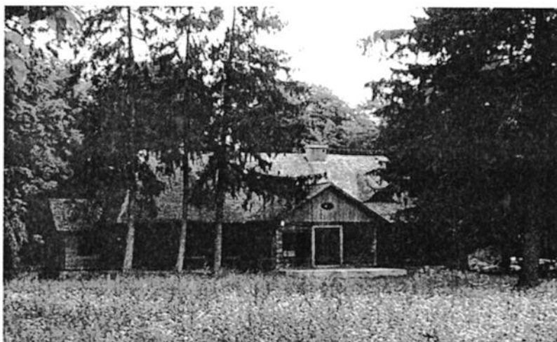
Ilustracja 7. Dwór w Łukomiu

Dwór murowany w Rościszewie powstał pod koniec XVIII w. dla ówczesnych właścicieli wsi Jeżewskich. Jego bryła zmieniała się w wyniku licznych przebudów w XIX i XX w. Wzniesiony został w stylu barokowym, jest to obiekt parterowy, trójskrzydłowy, murowany z cegły otynkowanej na fundamentach kamiennych, częściowo podpiwniczony. Korpus główny wzniesiony został na planie wydłużonego prostokąta z wysokim dachem dwuspadowym, z dobudowanymi prostopadle skrzydłami o dachach dwuspadowych niższych od dachu budynku głównego. Obecnie obiekt stanowi własność gminy, jest po gruntownym remoncie, zachowany w bardzo dobrym stanie. W skład tego założenia dworskiego wchodzi również spichlerz usytuowany po północnej stronie dworu. Powstał pod koniec XIX w. podczas rozbudowy dworu. Wzniesiony na planie prostokąta, dwukondygnacyjny, murowany głównie z kamieni polnych i częściowo cegły na otynkowanym cokole, kryty dachem półszczytowym. Obecnie obiekt nie pełni żadnej funkcji użytkowej, stanowi własność gminy i opracowany został dla niego projekt adaptacji zabytkowego obiektu na salę chopinowską. Elementem kompleksu zabudowań zespołu dworsko – parkowych była również stajnia ; budynek ten obecnie nie istnieje.