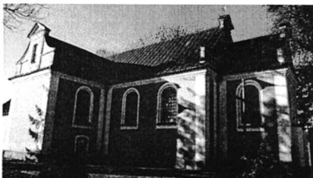
Ilustracja 1. Kościół parafialny w Rościszewie

z przynależnymi do nich dzwonicami oraz otoczeniem, ogrodzeniem i bramą przy kościele p.w. św. Józefa w Rościszewie.