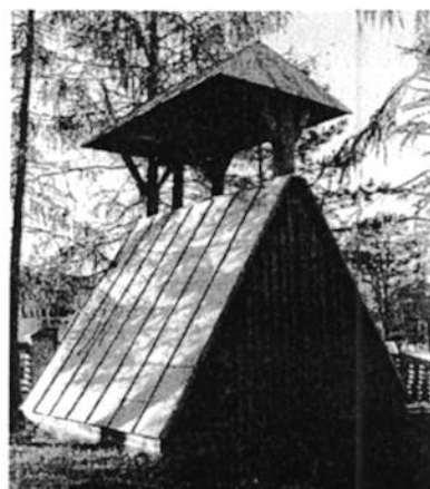
Ilustracja 5. Dzwonnica w Łukomiu

Kościół parafialny p.w. św. Katarzyny w Łukomiu zbudowany w 1761 roku z fundacji M. Kampnhausenowej. W II połowie XIX w. kościół rozbudowano, przedłużając część zachodnią wraz z budową wieży i kruchty. Świątynia jest orientowana, drewniana o konstrukcji zrębowej, na kamiennej podmurówce. Wnętrze kościoła utrzymane jest w stylistyce barokowej, z jednym średniowiecznym elementem w postaci późnogotyckiego krucyfiks na belce tęczowej. Usytuowany jest we wschodniej części wsi. Kościół jest trójnawowy, jednowieżowy z węższym prezbiterium i wąską kruchtą. Articulację ścian na zewnątrz stanowi pionowe, oszalowanie i odcinkowe okna oraz podokapowy gzyms.