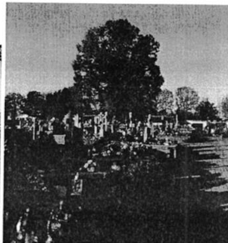
Ilustracja 11. Cmentarz w Rościszewie