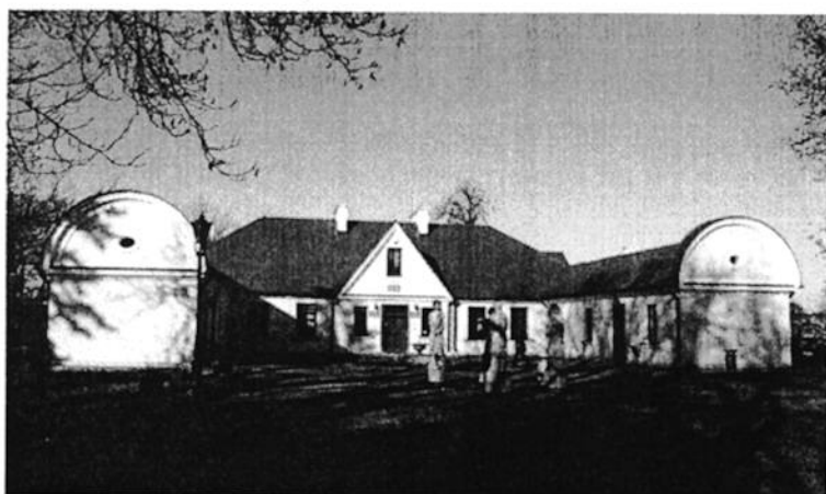
Ilustracja 6. Dwór w Rościszewie