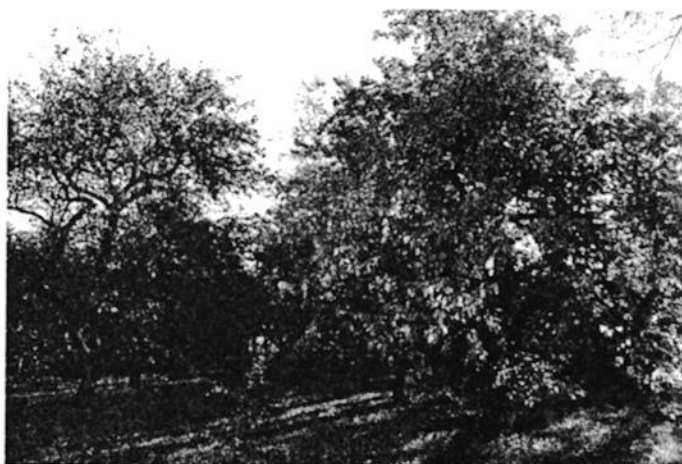
Ilustracja 9. Park w Łukomiu

Park w Łukomiu powstał na przełomie XIX i XX w., zajmuje powierzchnię około 3,7 ha. Położony jest na wysokim brzegu rzeki Skrwy, na jego terenie brak zbiorników wodnych. Stanowi on przykład ogrodu użytkowego z minimalnym układem dekoracyjno – wypoczynkowym. Ogród ma kształt wydłużonego prostokąta w układzie kwaterowym i usytuowany jest po południowej stronie drewnianego dworu, do którego od strony północnej prowadzi aleja obsadzona szpalerami kasztanowców. Po południowej stronie dworu znajduje się gazon obsadzony świerkami oraz krzewami. W zachodniej części