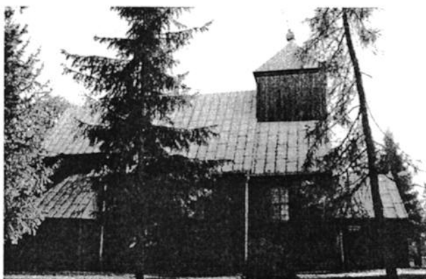
Ilustracja 4. Kościół parafialny w Łukomiu