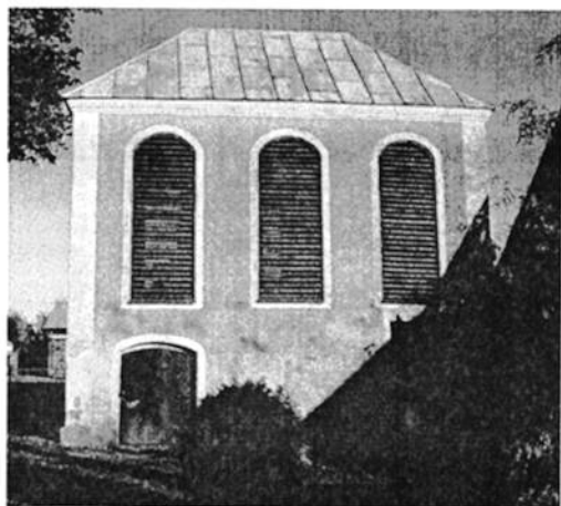
Ilustracja 2. Dzwonnica w Rościszewie