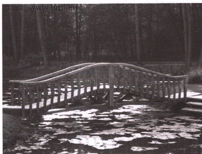
Fot.3 Przykład drewnianego mostu.

Drobne elementy wyposażenia parku, podobnie jak lampy oświetleniowe tj.: ławki i kosze i słupki ograniczające wjazd na teren parku, powinny nawiązywać do