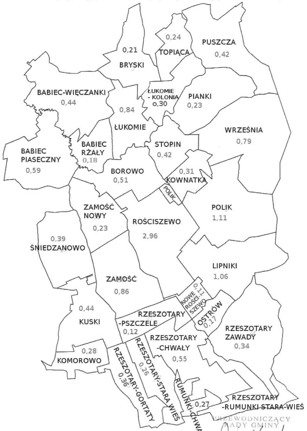
Mapa gminy z naniesionymi ułamkami mandatów przypadających na sołectwo (współczynnik normy przedstawicielstwa)